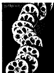
圖 2. 單片表示各分項作業