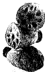
圖 1. 蓮藕塊莖表示整體工程

安全管理，廣泛的說是指任何可以接受的風險；一般常見的定義為：不會引起職業災害、造成人員生理或心理傷害、機械設備損害或破壞周圍環境等的現象。安全管理不是口號而是作為，係運用科學化的機制、配合智能化的器具特質、來達成效率化的管理目的，為了達成既定目標。遂營建工程的所有分項工程均從設計或規劃階段起步，因為分項工程的作業除了有聯屬關係外，也有橫向的連結就好像我們日常所吃的蓮藕（如圖 1.）可視為一個母體（亦整體工程）然母體可分割成許多藕片個體（如圖 2.）表示不同的分項作業、然而作業執行中由於天候及作業內外因素影響，可能造成潛存危害因子的顯現及發生。如果管理機制無法落實，安全防護就有缺口如同藕片的孔洞，危害因子就會趁隙通過，俟時機成熟時就爆發，而造成職業災害的發生。