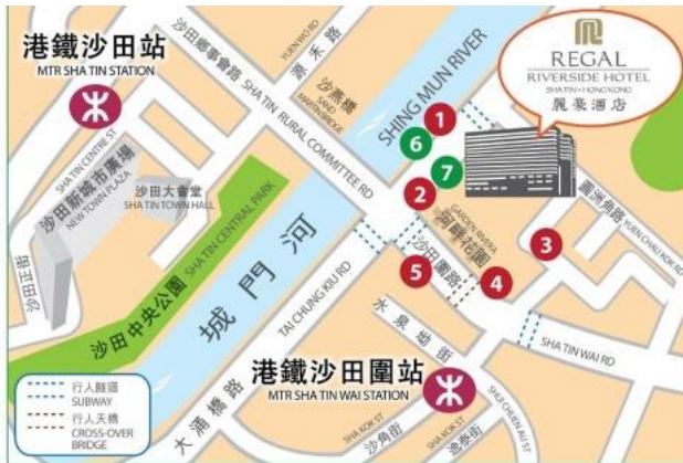
5 minutes walk from Sha Tin Wai Station 由沙田圍站步行至酒店只需5分鐘